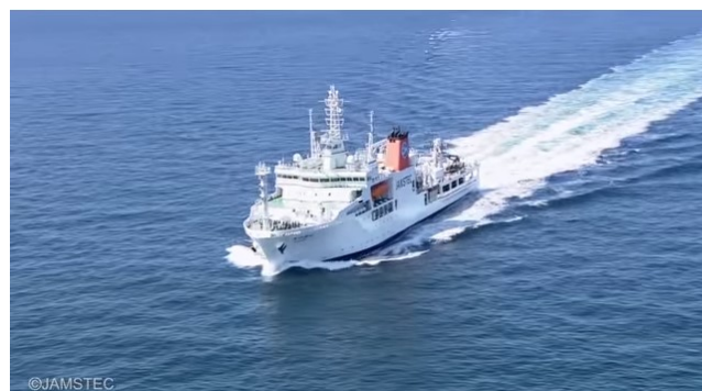
調査船「かいめい」 JAMSTEC HP より